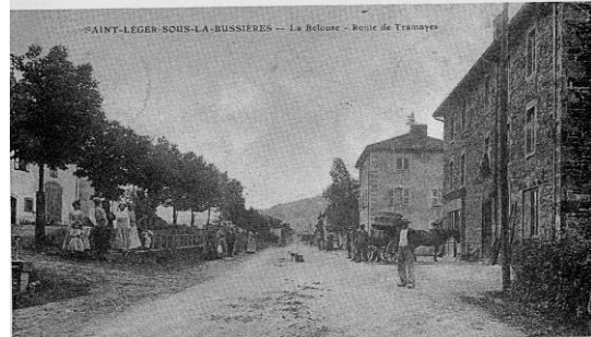
la Belouze : la B'louze indique un terrain fertile

Dans les années 1900 ce lieu-dit comptait : quatre aubergistes, une boulangerie, un charpentier, une couturière, un épicier, deux forgerons, un menuisier, un moulin et un sabotier.